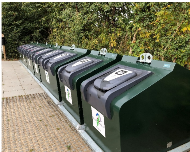
Overjordiske beholdere (flytbar)

Tømninger af disse beholdere vil være efter behov.