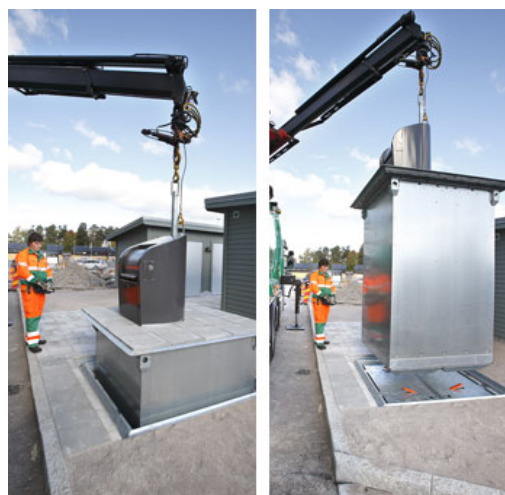
Helt nedgravede beholder